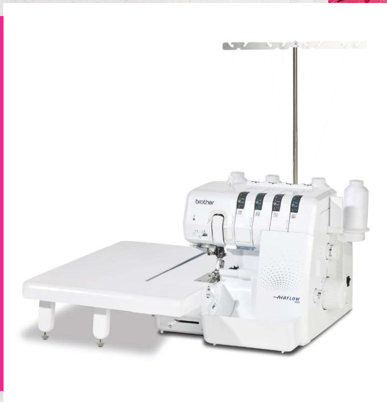
Velký rozšiřující stolek (není součástí základní výbavy)